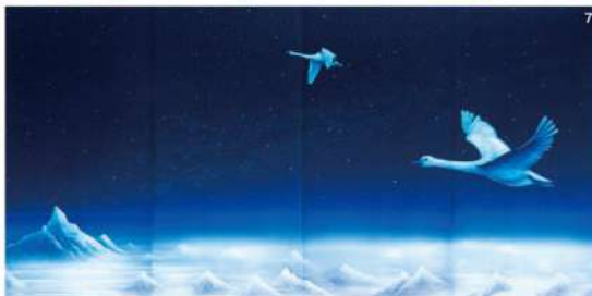
1.《夜明けの神戸》2021年 2.《極北の空》2021年 3.《YOU GOT WATER 01(部分)》2015年 4.《うたかたの夢》2020年 5.《天の羽衣》2021年 6.《約束の地へ》2017年 7.《Deep Current》2019年